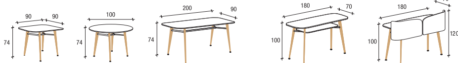
banco reception | counter desk | banc accueil