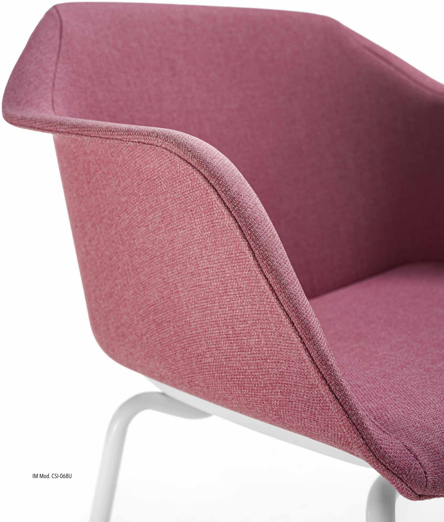
IM Mod. CSI-068U