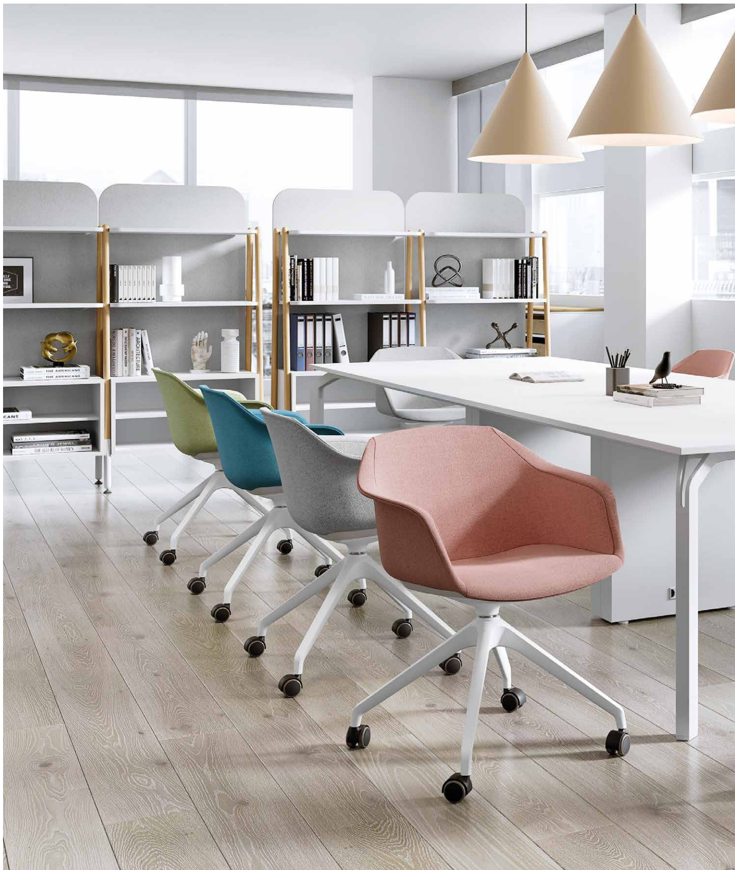
IM Mod. CSI-082U Libreria | Bookcase | Bibliothèque | Bücherregal Blog Concept