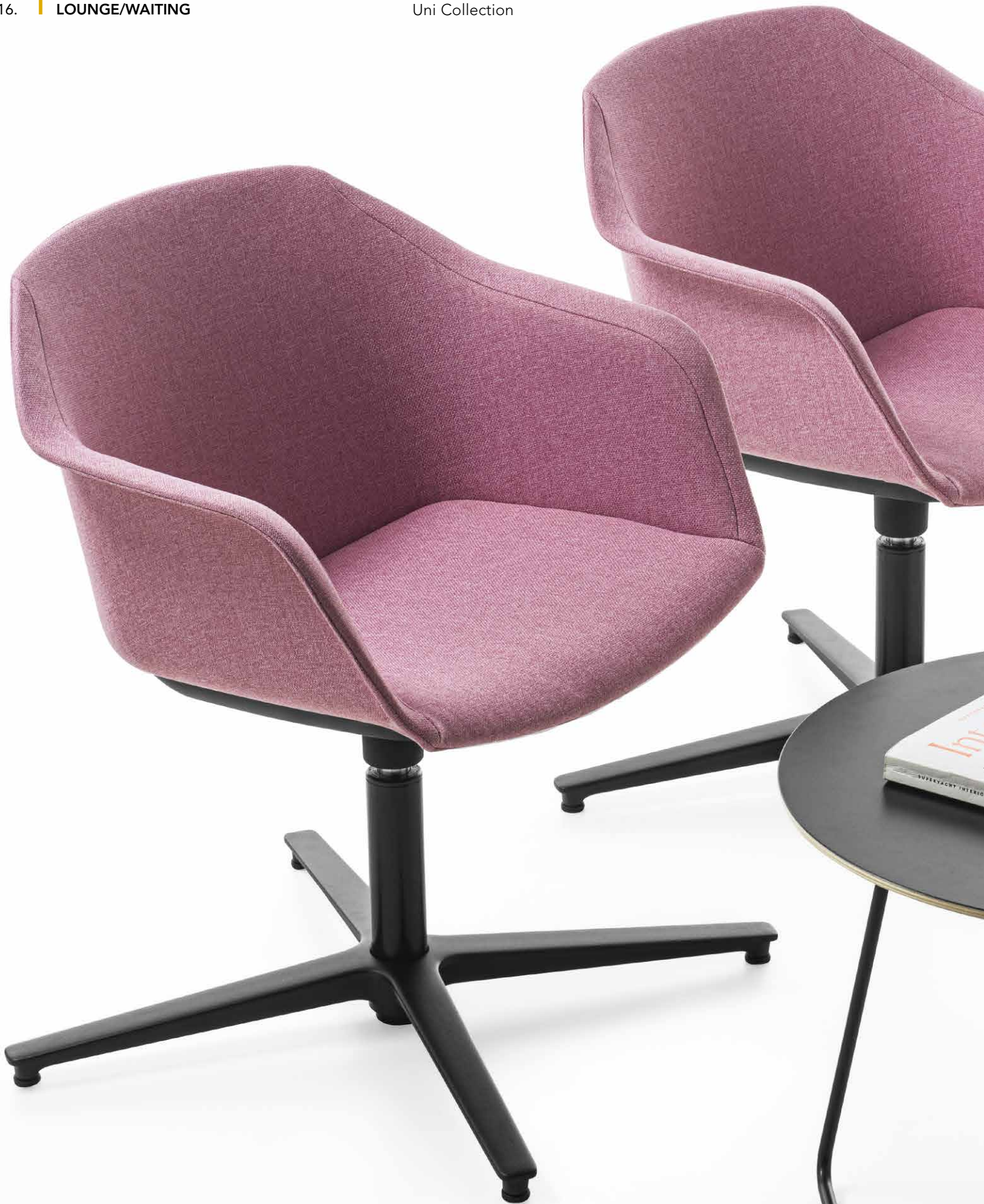
IM Mod. CSI-098U