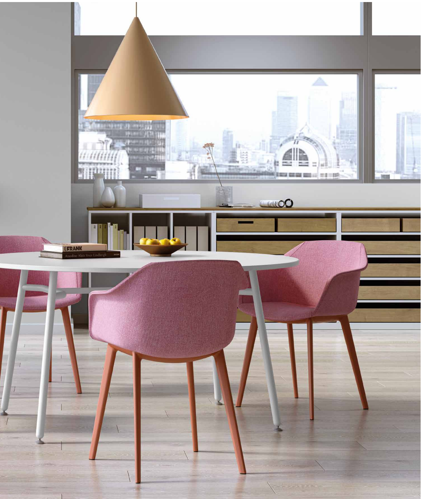
IM Mod. CSI-054U Tavolo | Table | Table | Tisch Blog Concept