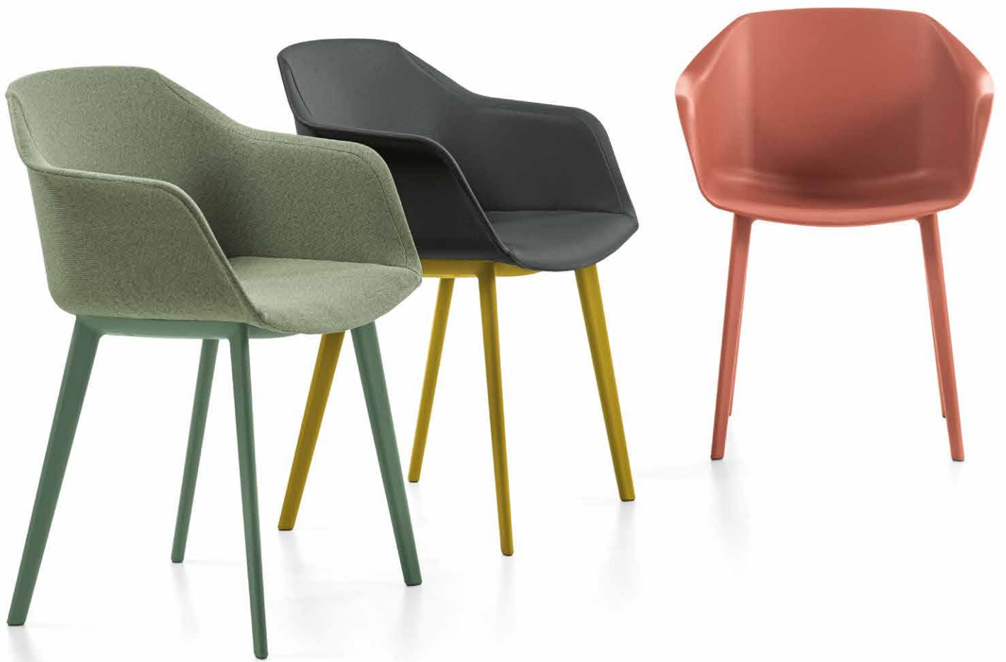
IM Mod. CSI-056U