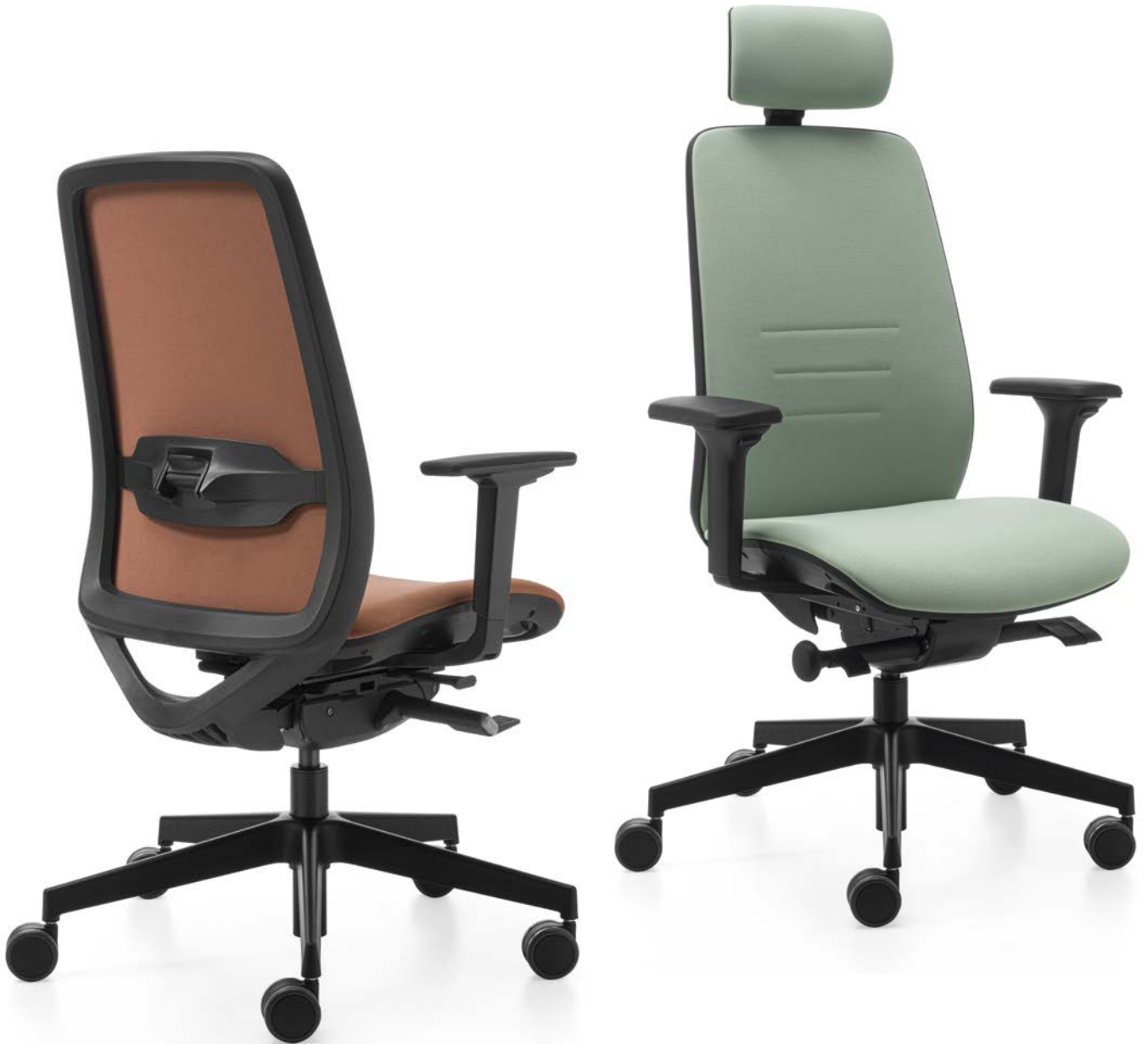
Mod. X1AA-046U + 22BH