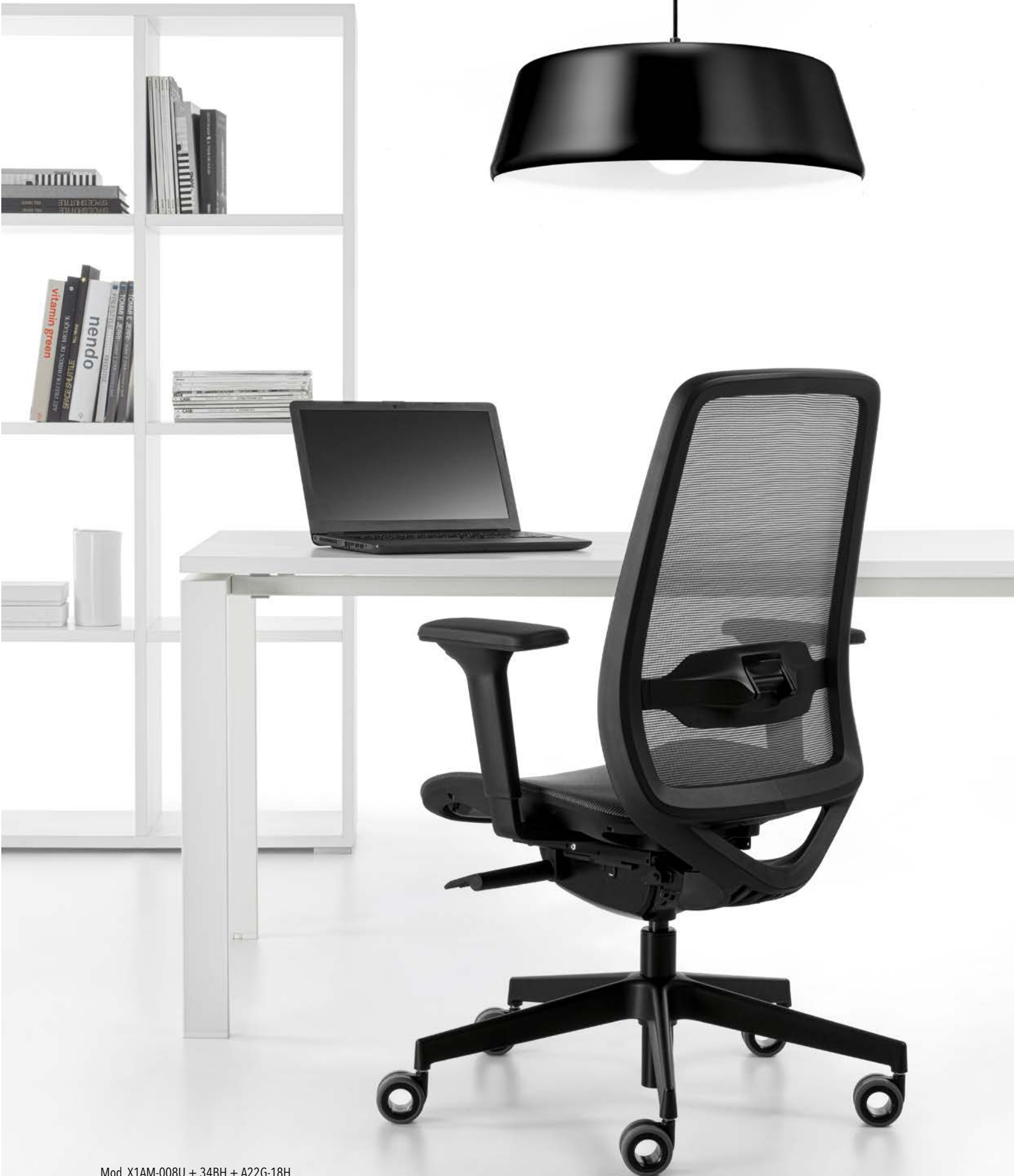
Mod. X1AM-008U + 34BH + A22G-18H