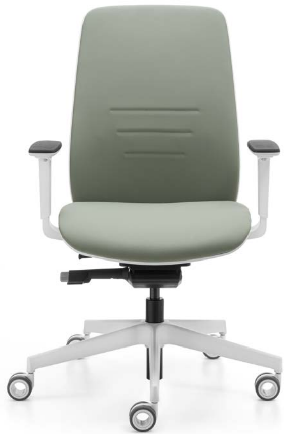
Mod. X1AA-W47U + 22BHW